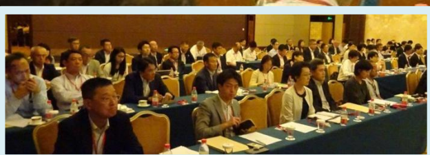
各報告を真剣に聞く参加者の皆さん