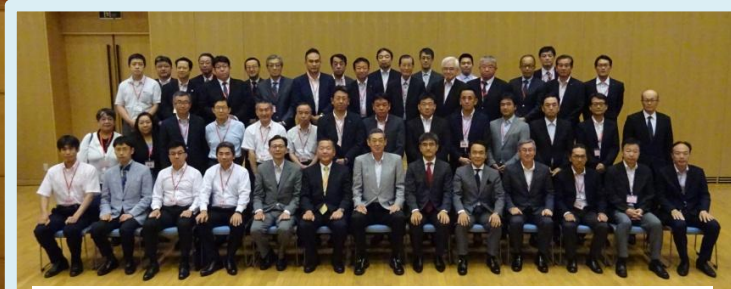
各地から集まった代表の方と横井大使との記念撮影