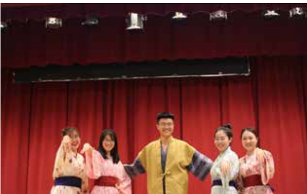
北京科技大学: (ホームステイ写真の提出なし) 今夜は、箱根温泉で、休息。全員 自然に笑みがこぼれます。