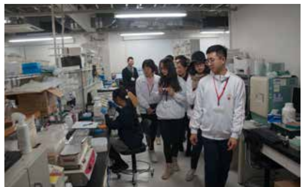
大阪大学:世界トップレベル国際研究拠点の免疫学フロンティア研究センターを見学しました。