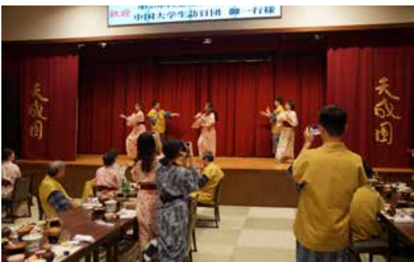
箱根観光: 宴会 出し物のダンス、前列のキレイのある手足の動きと、後列の緩慢な左右の往復が笑いを誘いました。