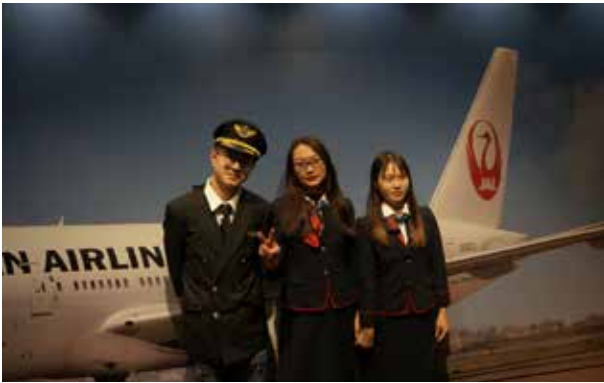
JAL整備工場:制服体験エリアで、大学生から、JALクルーに、瞬間に変身。