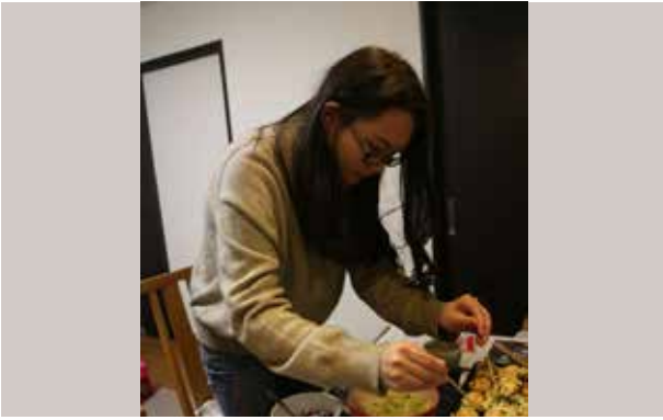
北京外国語大学: 教えられた通りに、たこ焼を作ってみる、二本の串を器用に使う。