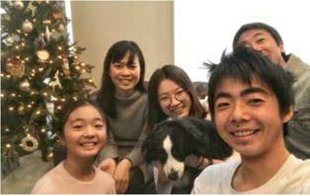
北京大学: 飼い犬が、慣つてくれたところで、一家全員で一枚。