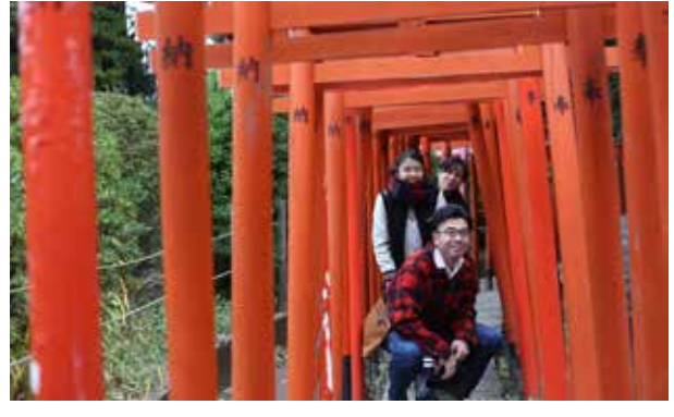
中国農業大学: パワースポットで有名な根津神社の千本鳥居を通過、邪気祓いを済ませる。