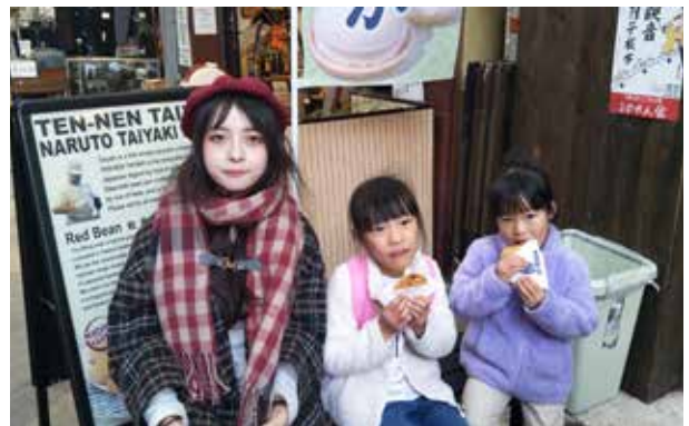
北京林業大学: カメラが向けられたので、鯛焼きをさつと食べて、ポーズをとりました。