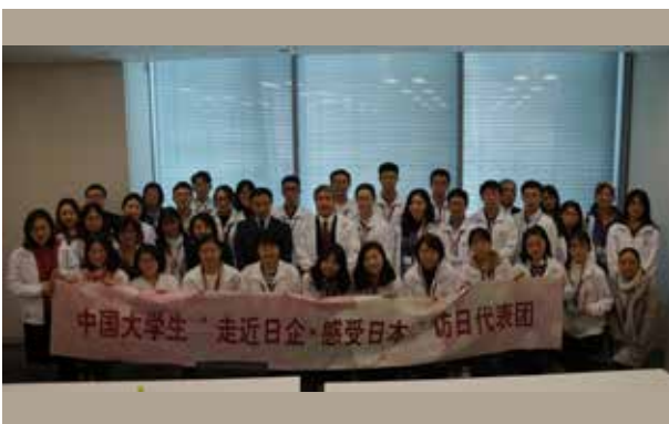
三菱UFJ銀行:活発な質疑応答が終わり、会議室で記念撮影。