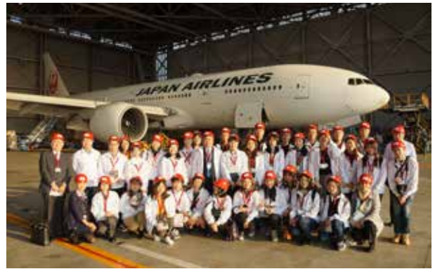
JAL整備工場:広大な格納庫内の巨大な機体、高揚感に包まれたところで、一枚。