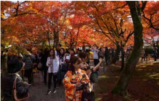
京都観光: 東福寺 紅葉のトンネルを散策する、日本人の美感と季節感に近づきました。