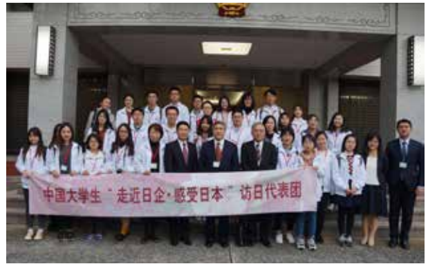
中国大使館：律公使参事官を中心に記念撮影、右端が付博二等書記官