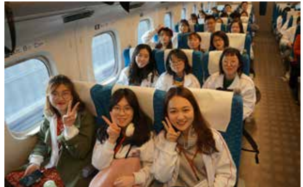
新幹線: 京都観光を終え、京都から小田原まで「ひかり」号で移動しました。