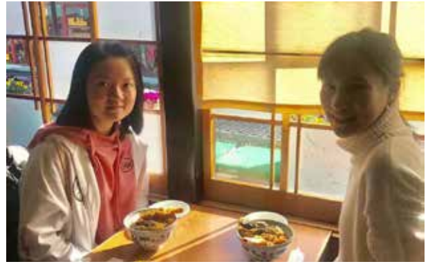
北京師範大学: お昼 温かい天井を前にして、姿勢を正して、まぜ一枚。