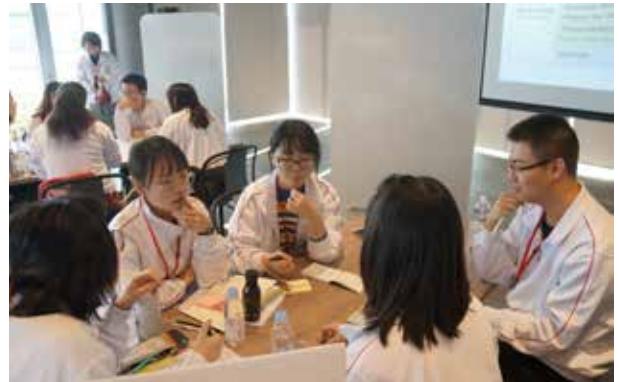
Panasonic Design Kyoto:グループワーク、テーマは、「弁当」、各校とも発想が豊かで、充実した時間を過ごしました。