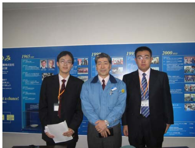
图 2：北村社长和本文两位作者合影

另一方面，正如上文提到的，欧姆龙京都太阳工厂内的多数管理体制改革和技术手段创新都由残疾人组织完成的。比如由员工自行使用 Access 开发的管理程序，以及红色供应架也是工厂自行开发的。带领我们参观的介绍员还特意给我们介绍了两位出色的设计者。